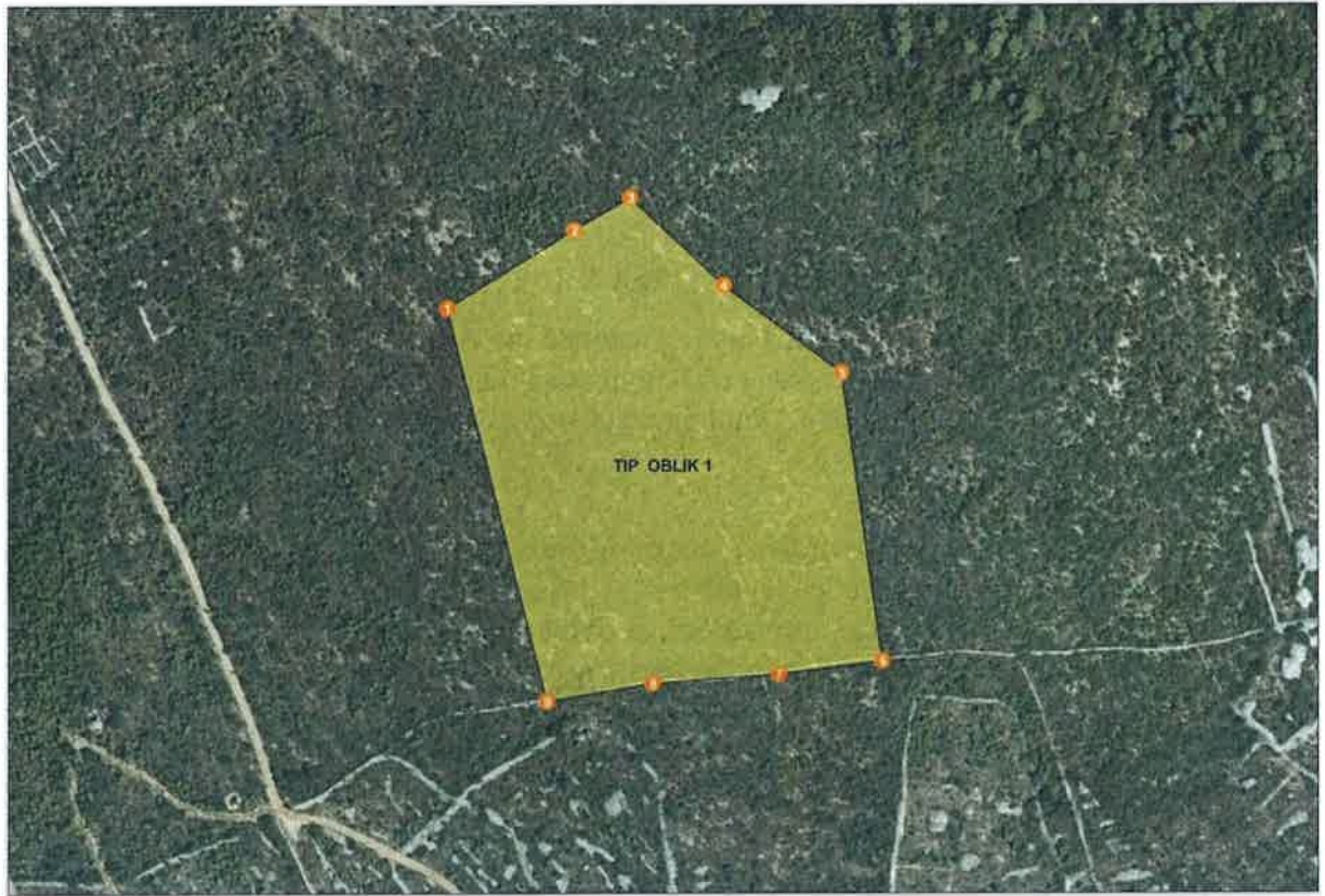
Grafički prikaz traženog istražnog prostora tehničko-građevnog kamena "Oblik 1"